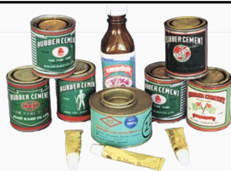
สารระเหย